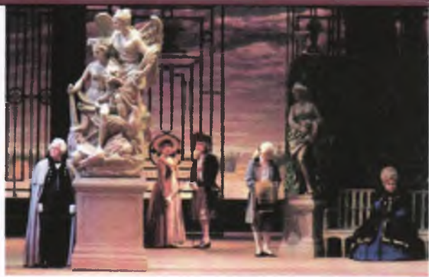
3. Спектакль по произведению Н. В. Гоголя «Ревизор».