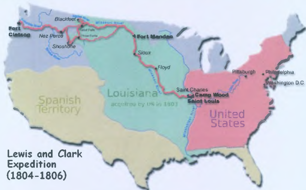
Lewis and Clark Expedition (1804-1806)

В 1804-1806 гг. под руководством М. Льюиса и У. Кларка совершена первая сухопутная экспедиция через территорию США к тихоокеанскому побережью. У. Кларк с небольшим отрядом впервые прошел среднее течение одного из правых притоков реки Миссури (индейский народ кроу называл эту реку Вапити). В верхнем течении река образует каньоны и водопады, в среднем и нижнем течении она спокойная и равнинная. Суеверная тревога спутников-индейцев не позволила У. Кларку слегка отклониться от намеченного пути и выяснить, что за грохот им слышался неподалеку. Экспедиция была в шаге от события, открытие которого было бы грандиозным. Далее экспедиция спустилась вниз по реке, названной впоследствии Колумбией, до Тихого океана, а в 1806 г. вернулась в Сент-Луис.