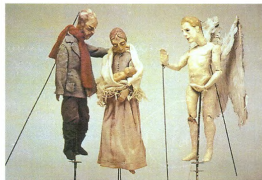
4 На сцене На сцене