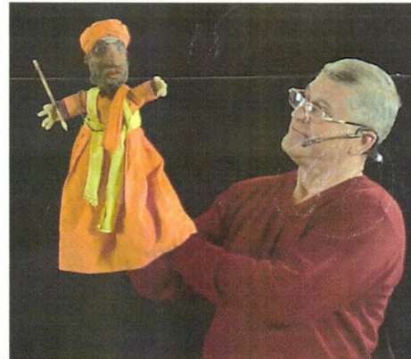
2 С пидоай рукой