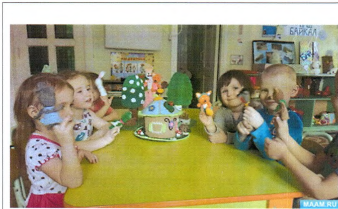
1 Пальчиковая кукла