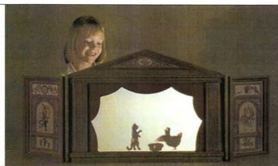
6 Кукла театра теней