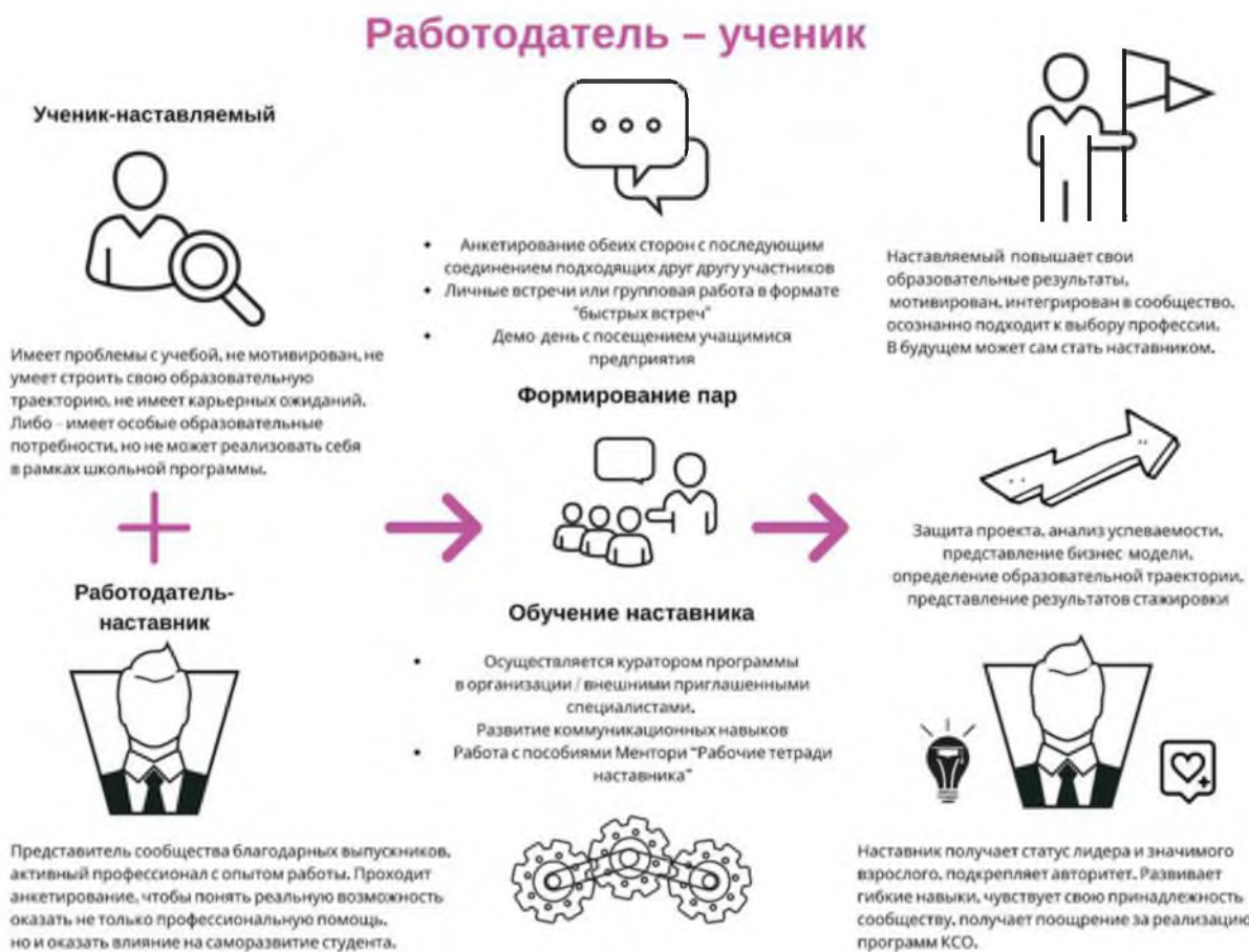
Рисунок 4. Графическое представление наставнического взаимодействия по форме «работодатель – ученик»