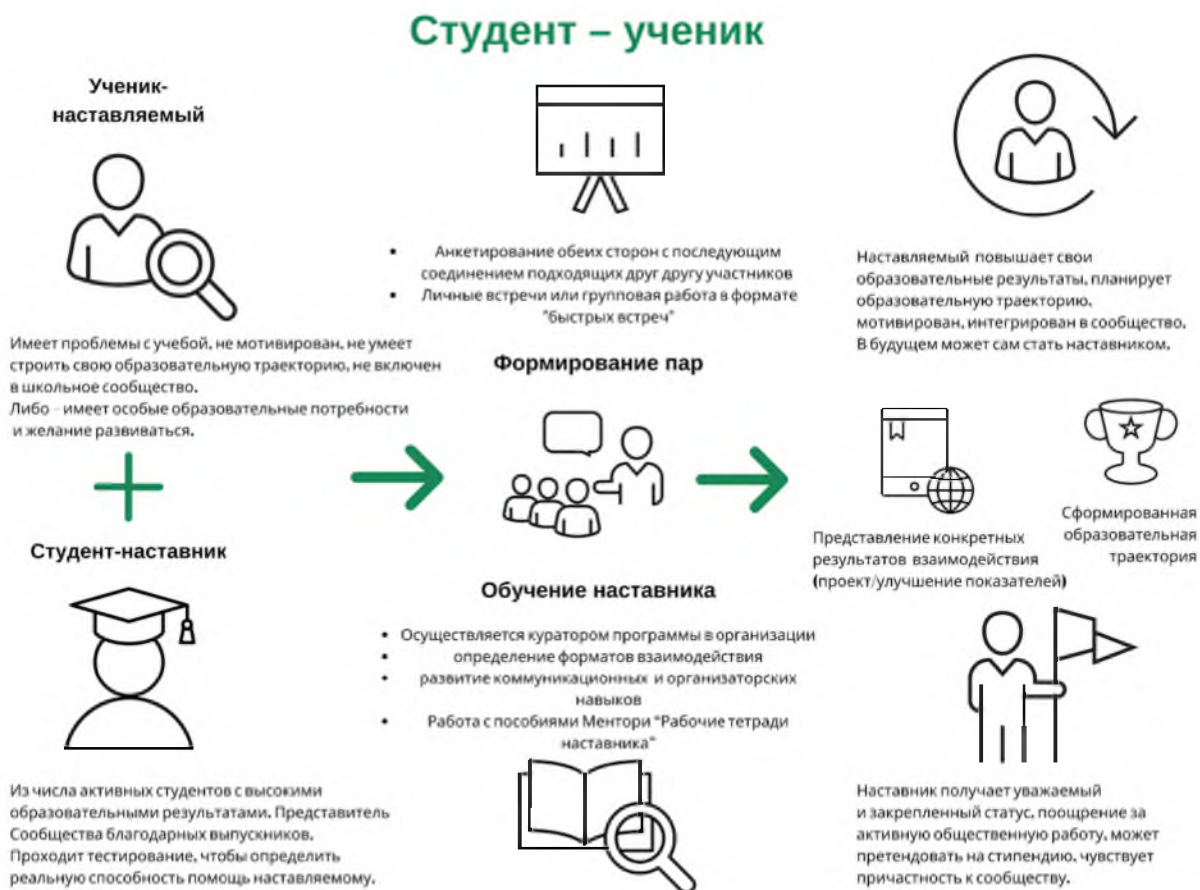
Рисунок 3. Графическое представление наставнического взаимодействия по форме «студент – ученик»