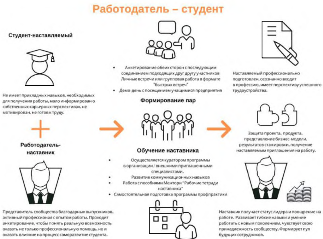
Рисунок 5. Графическое представление наставнического взаимодействия по форме «работодатель – студент»