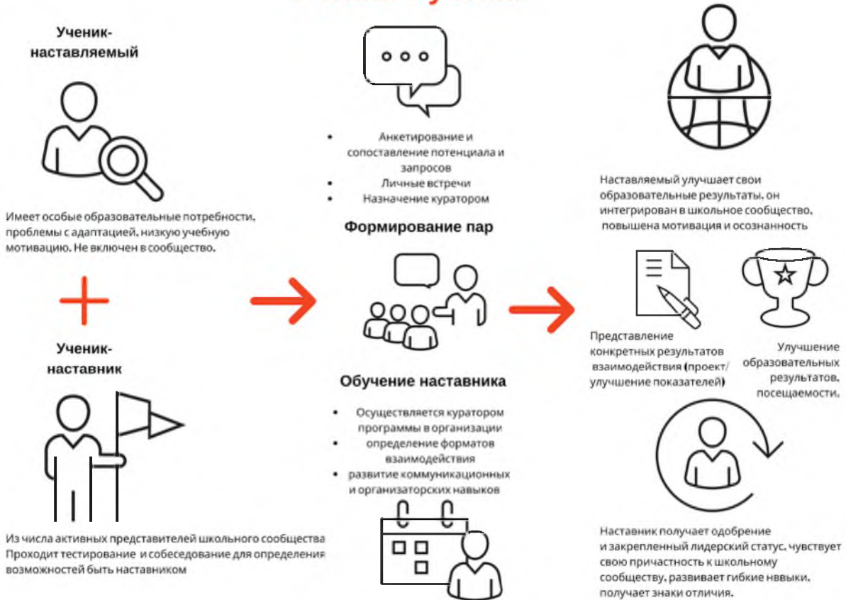
Рисунок 1. Графическое представление взаимодействия по форме «ученик – ученик»