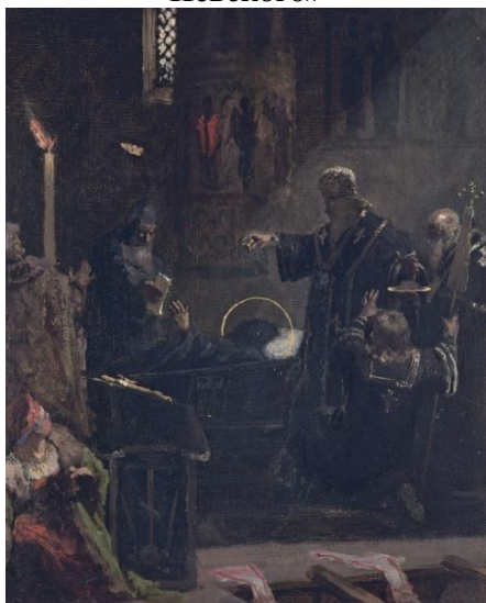
Г. Семирадский, «Погребение Александра Невского»