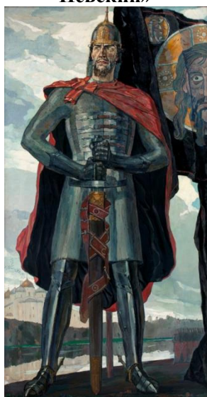
П. Корин, фрагмент триптиха «Александр Невский»