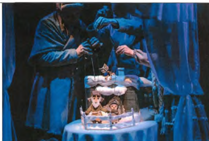
2. П. Бажов «Серебряное копытце»