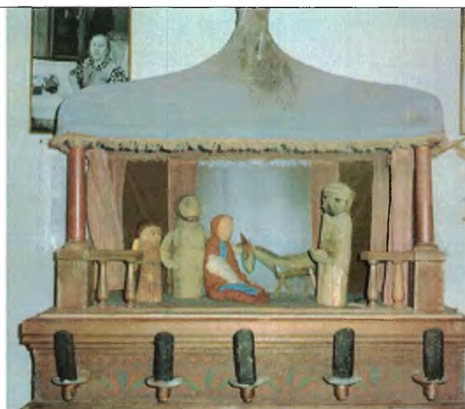
4. «Сказка о царе Ироде...»