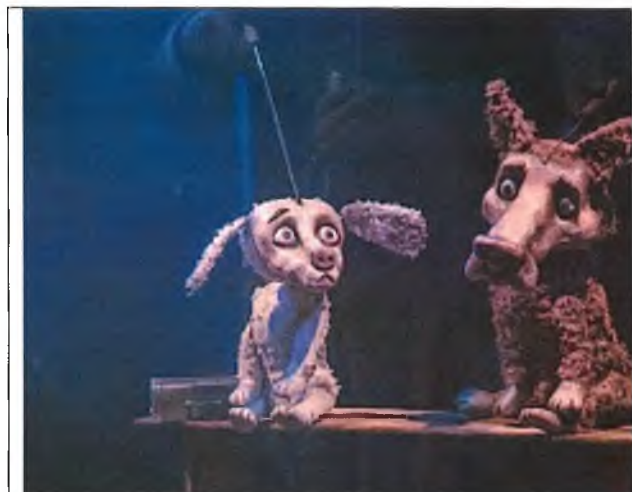
1. Ю. Пospelова «Бах-бах-бах!»