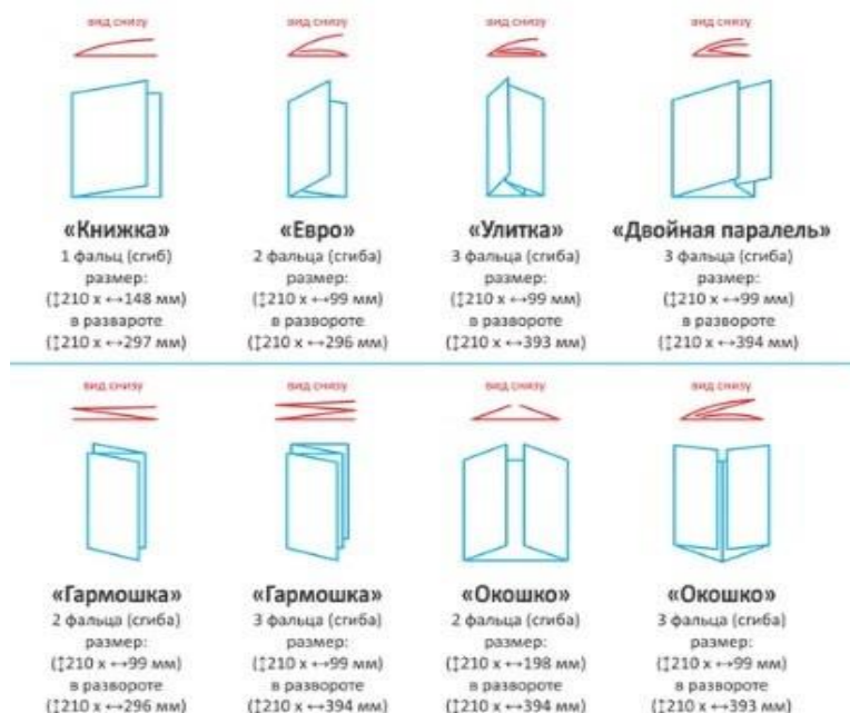
Рисунок 2. Виды буклетов