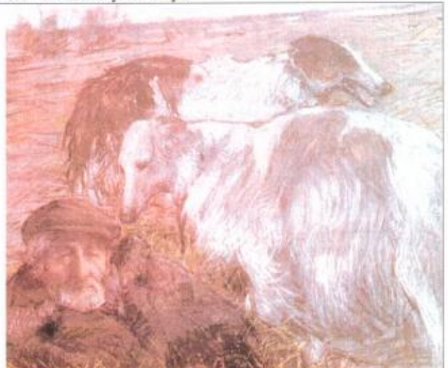
2. А.Н. Либеров. Я и мои друзья. 1975 г.