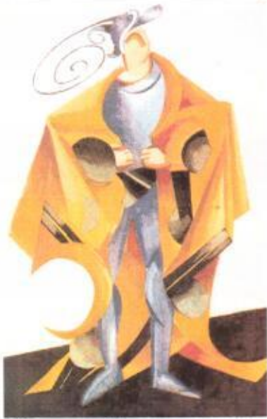
3. А.А. Экстер. Парис на балу. Эскиз театрального костюма. 1921 г.