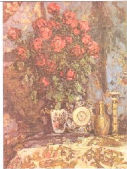
6. П.И. Петровичев Розы. 1913 г.