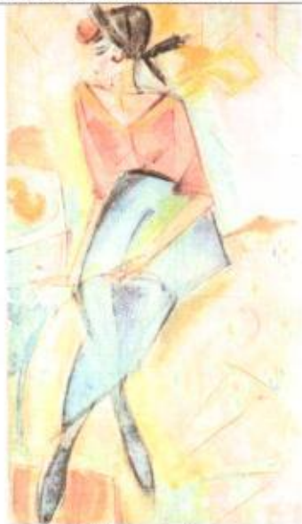
5. В.П. Уфимцев. Женский портрет. 1920-е г.