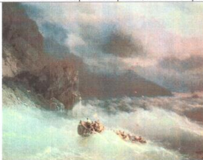
1. И.К. Айвазовский. Буря на Черном море. 1873 г.

5. Напишите номер иллюстрации, соответствующей каждому слову.