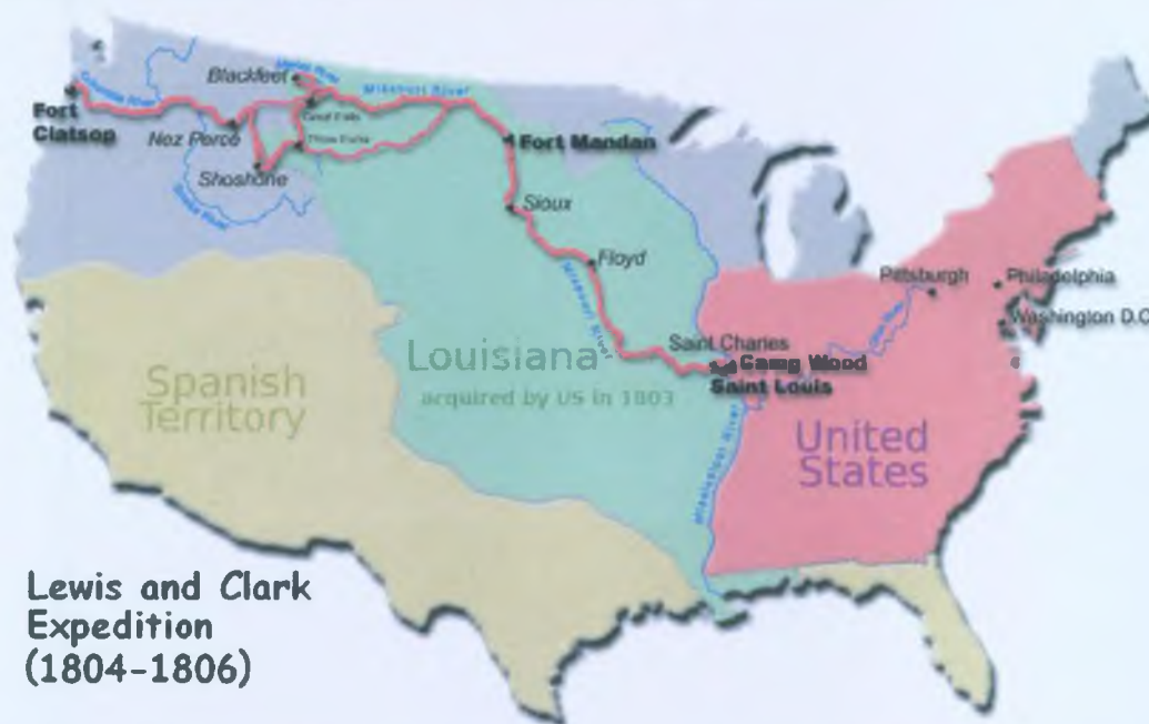
Lewis and Clark Expedition (1804-1806)

В 1804-1806 гг. под руководством М. Льюиса и У. Кларка совершена первая сухопутная экспедиция через территорию США к тихоокеанскому побережью. У. Кларк с небольшим отрядом впервые прошел среднее течение одного из правых притоков реки Миссури (индейский народ кроу называл эту реку Вапити). В верхнем течении река образует каньоны и водопады, в среднем и нижнем течении она спокойная и равнинная. Суеверная тревога спутников-индейцев не позволила У. Кларку слегка отклониться от намеченного пути и выяснить, что за грохот им слышался неподалеку. Экспедиция была в шаге от события, открытие которого было бы грандиозным. Далее экспедиция спустилась вниз по реке, названной впоследствии Колумбией, до Тихого океана, а в 1806 г. вернулась в Сент-Луис.